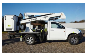
Brazo articulado inferior y 2 etapas pluma superior telescópica