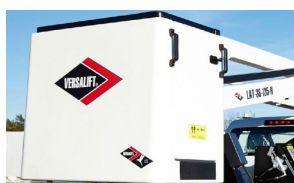
Cesta para 2 personas (con puerta)