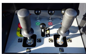
controles hidráulicos superiores