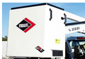
Cesta para 2 personas (con puerta)