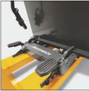
Gestión profesional de la batería